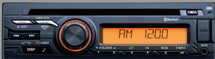
Bluetooth/USB/CD/MP3/WMAレシーバー 品番:1-8841-1389-0 価格: ¥36,300 (本体価格¥33,000)+取付費 (0.5H)