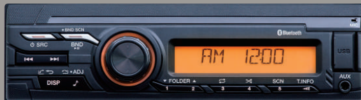
Bluetooth/USB/MP3/WMAレシーバー 品番:1-8841-1388-0 価格: ¥31,350 (本体価格¥28,500)+取付費 (0.5H)