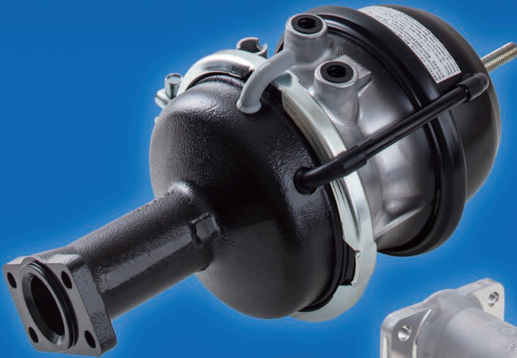
ウェッジチャンバ (ピギーバック付)